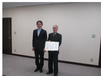
左：坂本福島区長 右：受け取る白井社長