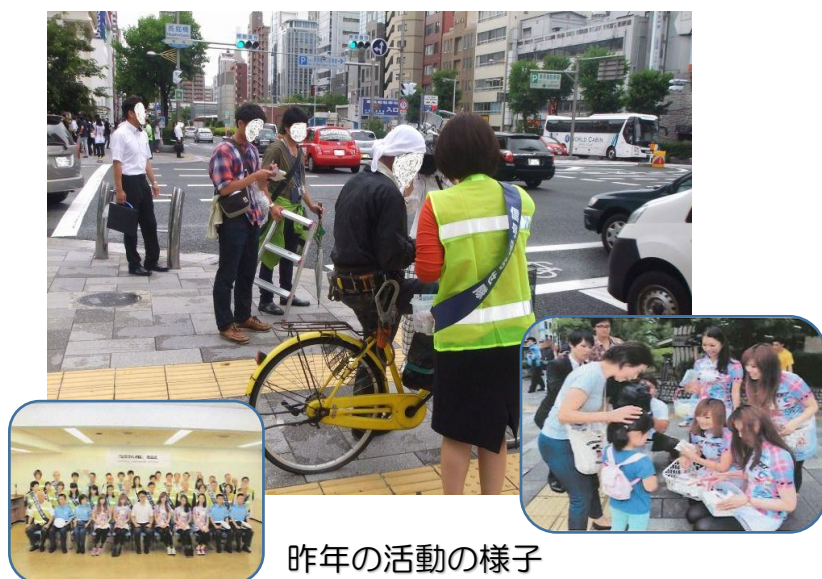
昨年の活動の様子