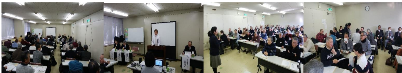
当日の研修の様子

参加者の方からは、接客・接遇の基本に立ち返ってお客様満足度向上の重要性を再認識できた。との声も聞かれ、充実した研修になりました。