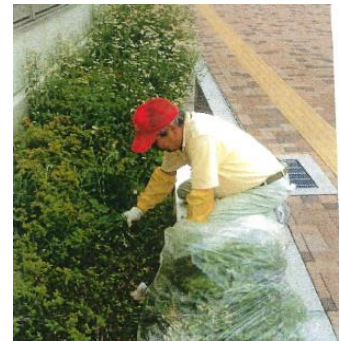
植栽はいつも綺麗に!!