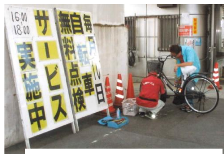
自転車無料点検サービスの実施