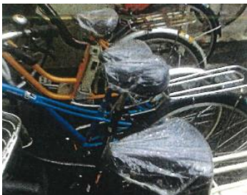
屋外部分では雨の日はサドルに シャンプーキャップをつけるサービスを