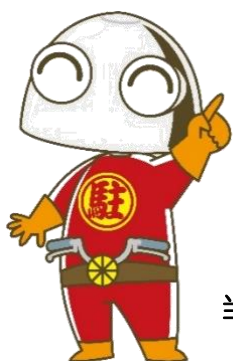
当社マスコットキャラクター 「駐輪くん」

お客様からの貴重なご意見・ご要望等は ホームページでも受付けております。 検索サイトもしくは下記のQRコードから アクセスいただけます。