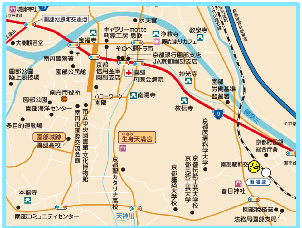
南丹市ホームページ「観光マップ」

お問い合わせは、園部西口広場自転車駐車場管理事務所（0771-68-1234）まで